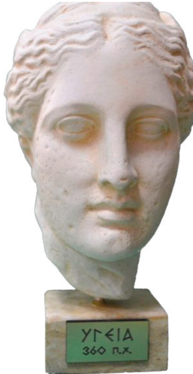
Αντίγραφο προτομής Υγείας 360 πΧ

Για τους πιο κοντινούς συγγενείς μας, γιατρούς, νοσηλευτές και επαγγελματίες υγείας παλιούς και νέους που στηρίζουν την εφημερίδα μας “Η Φωνή των Α.Μ.Ε.Α.” με την συνδρομή τους προσφέρουμε εντελώς ΔΩΡΕΑΝ ανάγλυφο τον όρκο του Ιπποκράτη ή την προτομή της Υγείας. Ένα πολύ όμορφο δώρο που κατασκευάζουν τα μέλη του Κοινωνικού Συνεταιρισμού Ένταξης Ευάλωτων Ομάδων «Συνεργασία – Δημιουργία». Βασικός στόχος του Φορέα μας είναι η υλοποίηση δράσεων εκπαιδευτικού χαρακτήρα με σημαντικό κοινωνικό αντίκτυπο, για την καταπολέμηση του κοινωνικού αποκλεισμού και της περιθωριοποίησης των ΑμεΑ. Χαρά μας θα είναι να μας επισκεφτείτε για να διαπιστώσετε ότι η συμμετοχή σας είναι απαραίτητη στο έργο μας και μπορεί πραγματικά να αποδώσει ουσιαστικά!!!